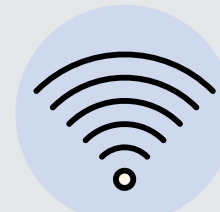
CONEXIÓN WIFI O CELULAR