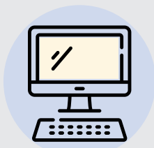
COMPUTADORA CON CÁMARA